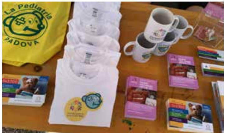
Gadgets e materiale della Fondazione