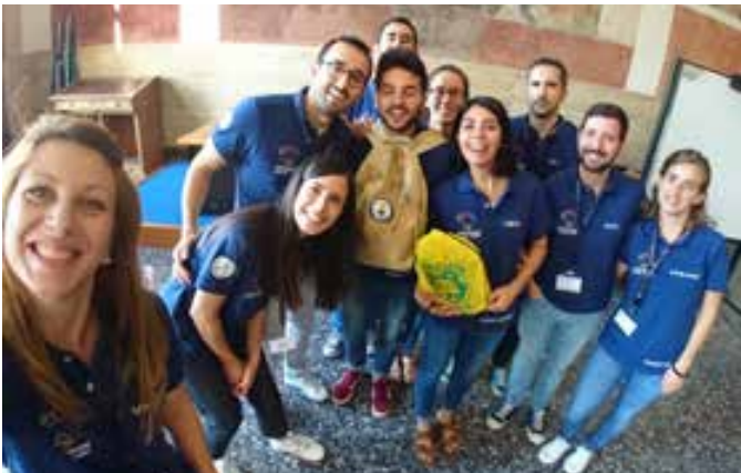
Gli specializzandi ai Pediatric Simulation Games