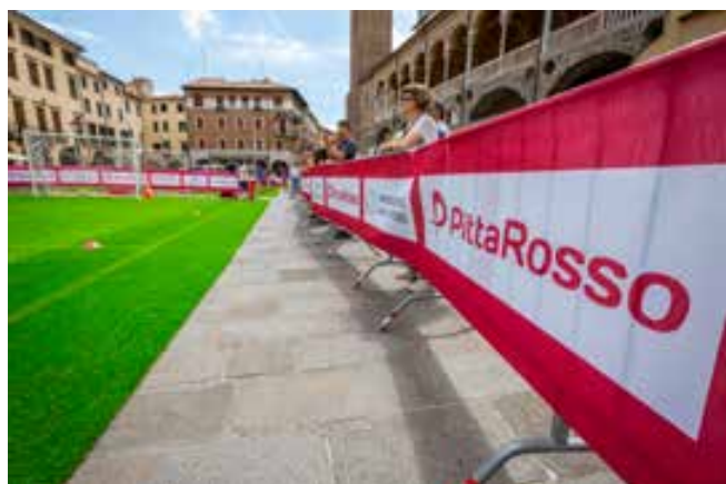
Pittarosso all'evento Play for Kids