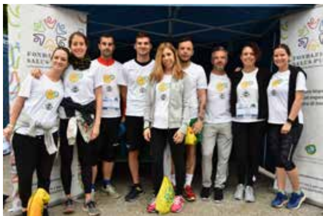
Il team dell'azienda Solgar

Perchè lo facciamo? La Fondazione è ormai diventata una conferma all'interno della realtà veneta e tra i suoi scopi ha quello di creare relazioni positive e di collaborazione con tutti gli altri attori che come lei agiscono sul territorio con un unico scopo : raggiungere sempre nuovi traguardi a favore della Pediatria di Padova .