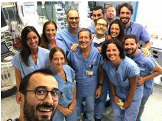
Una parte dell'équipe della TIPED

Il reparto di Terapia Intensiva Pediatrica (TIPED), istituito nel 1990, accoglie ogni anno 400-450 bambini e ragazzi fino ai 18 anni, provenienti dal territorio padovano, dalla regione, da Ospedali extraregionali e affetti da malattie mediche o chirurgiche che necessitano di cure intensive, diventando così il centro di riferimento regionale per la cura del bambino critico .