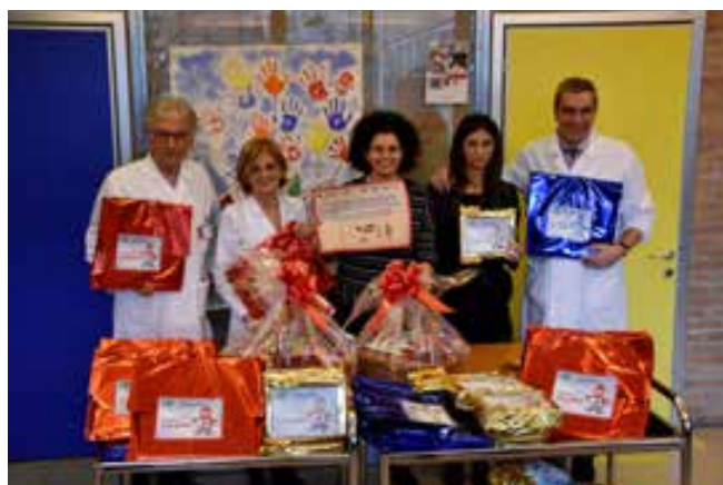
Pam Panorama consegna i regali di Natale in Pediatria