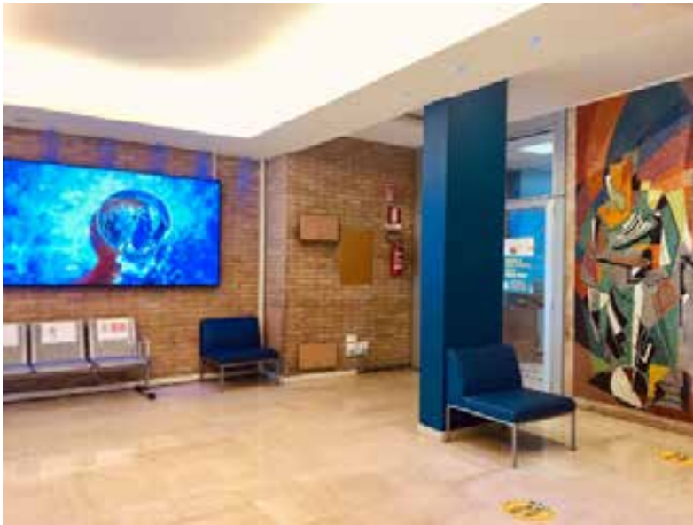
Mega schermo acquistato dalla Fondazione installato in atrio