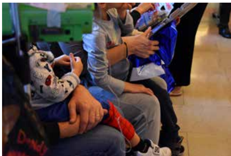
Consegna dei regali di Natale di Pam