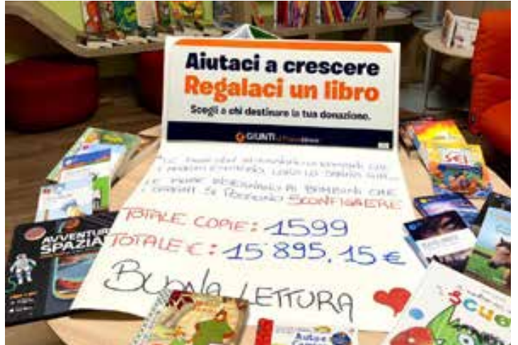
Progetto Aiutaci a crescere, regalaci un libro!