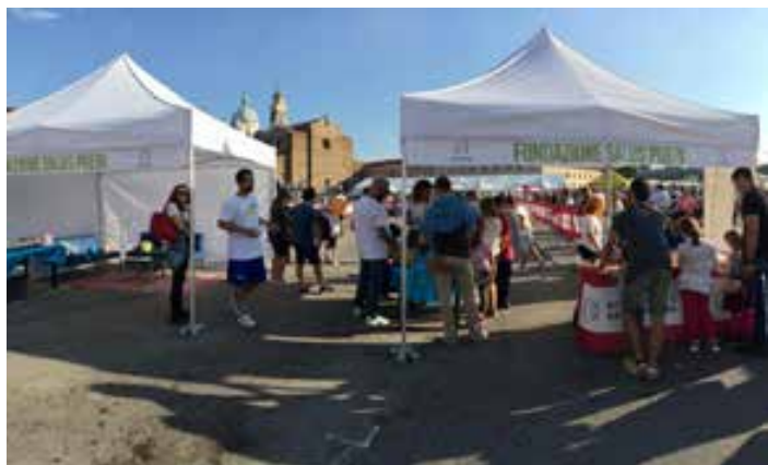
Stand Salus Pueri a Solidaria