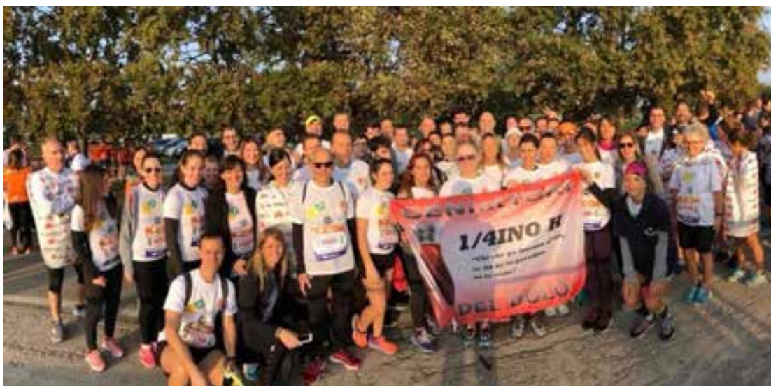
La squadra dei GENIatTORI del Dolo alla Venice Marathon 2019 in corsa per la Pediatria