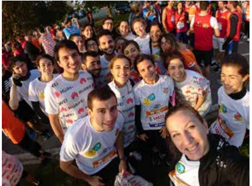
La squadra degli Specializzandi alla Venice Marathon 2019

Il connubio tra sport e beneficenza è risultato ancora una volta vincente, e l'entusiasmo con cui i runner accolgono l'iniziativa è l'ingrediente fondamentale per far decollare una campagna benefica e per riuscire a raggiungere considerevoli e importanti obiettivi a favore del benessere di tutti i nostri piccoli pazienti della Pediatria di Padova e delle loro famiglie.