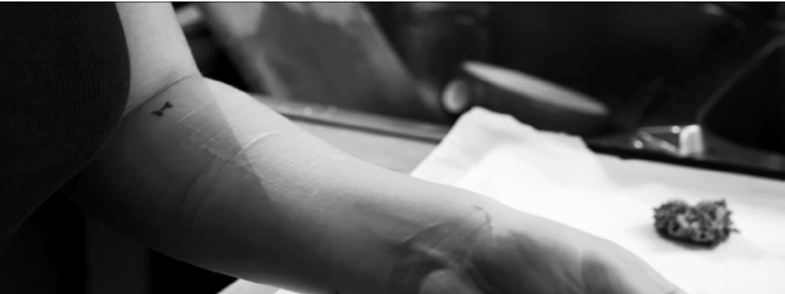
Frame tratto dal docufilm "Come stanno i Ragazzi"