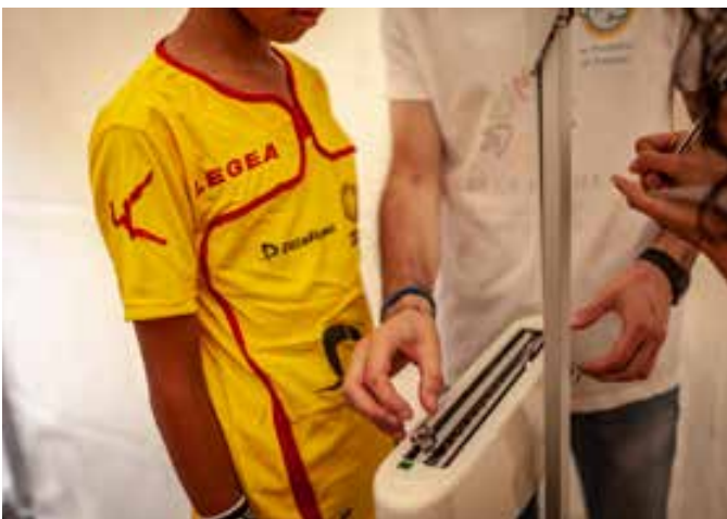
Play for Kids, check up salute con gli specializzandi della Pediatria