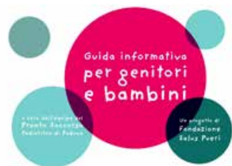
Le guide animate del Pronto Soccorso Pediatrico