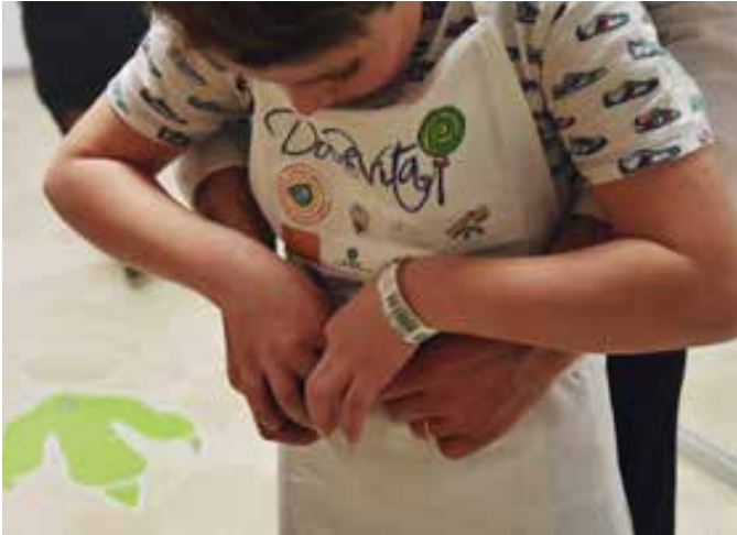
Dolcevita in Pediatria