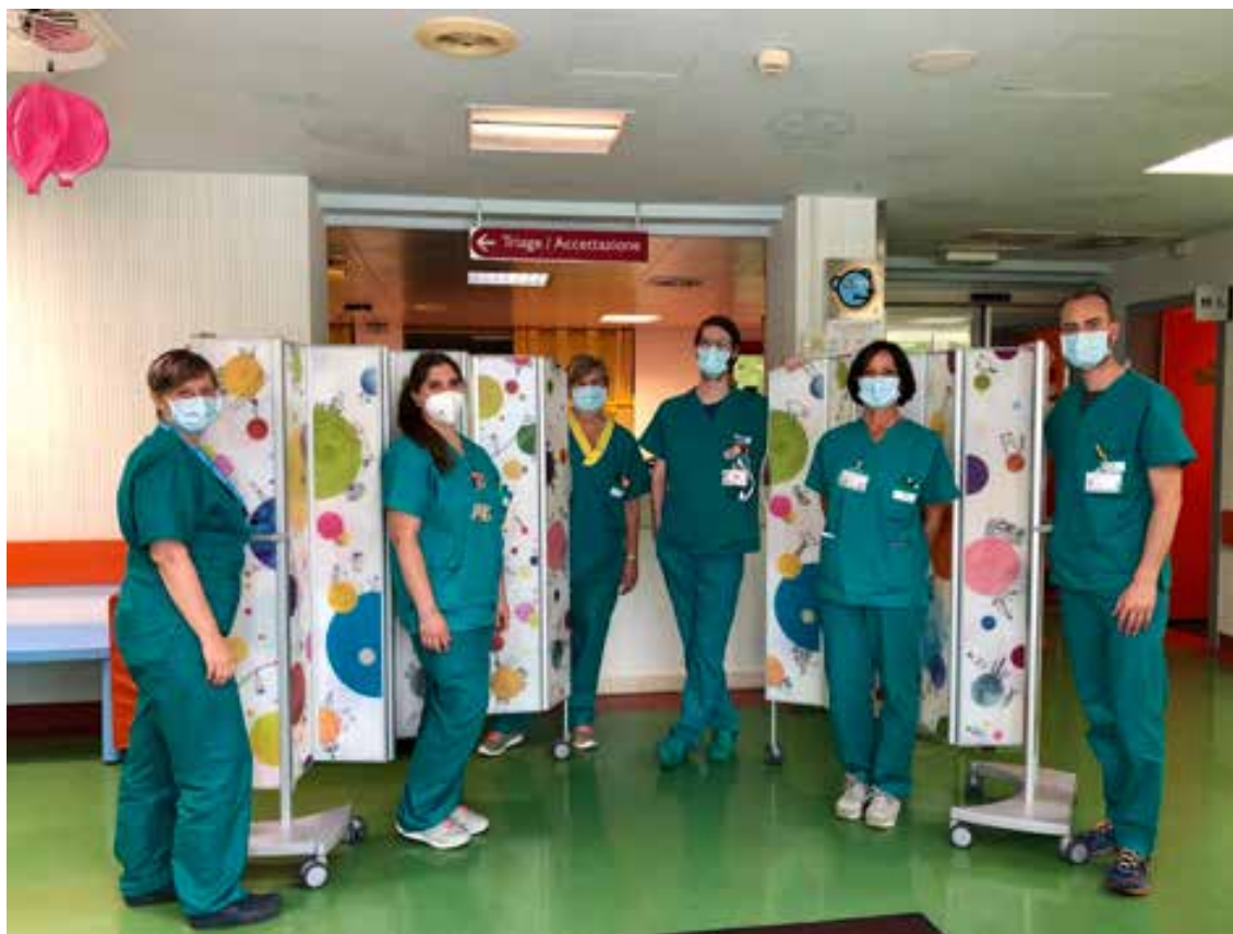
Consegna dei paraventi acquistati per il Pronto Soccorso Pediatrico e Pediatria d'Urgenza