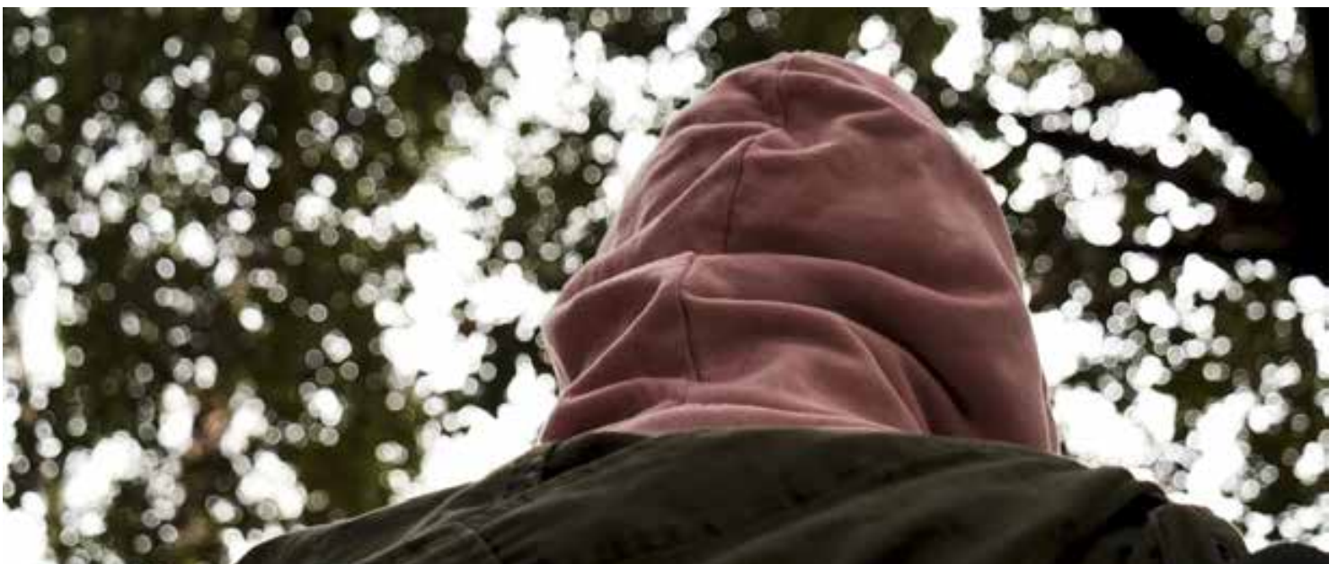
Frame tratto dal docufilm "Come stanno i Ragazzi"

Il documentario è stato pensato come strumento di sensibilizzazione , di educazione alla salute e di formazione rivolto a tutti coloro che si occupano di minori, nonché di riflessione sociale su un tema delicato, come quello della sofferenza psichica in età evolutiva, con l'obiettivo di riuscire ad abbattere il muro di silenzio che circonda i nostri ragazzi e le loro famiglie per trasformarlo in un messaggio di speranza.