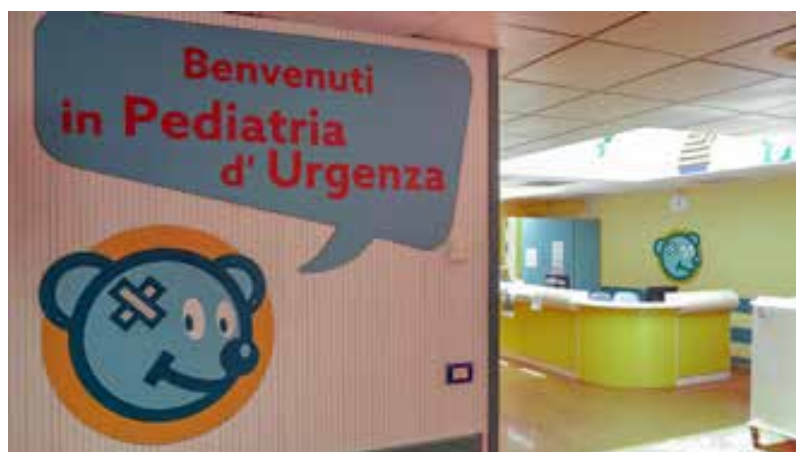
Nuovo corridoio di Pediatria d'Urgenza