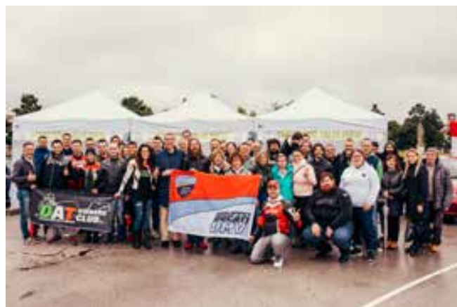
Il gruppo dei Ducatisti