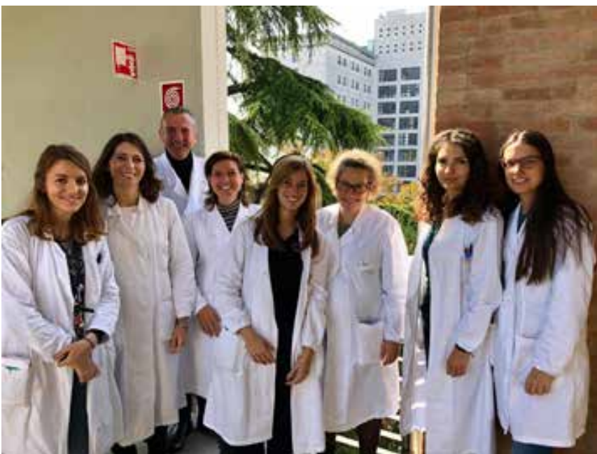
Equipe di Neuropsichiatria Infantile