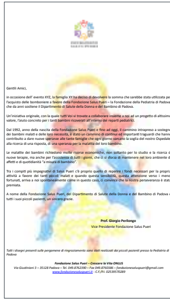
Foto in alto a sinistra

I biglietti di Natale della Salus Pueri.